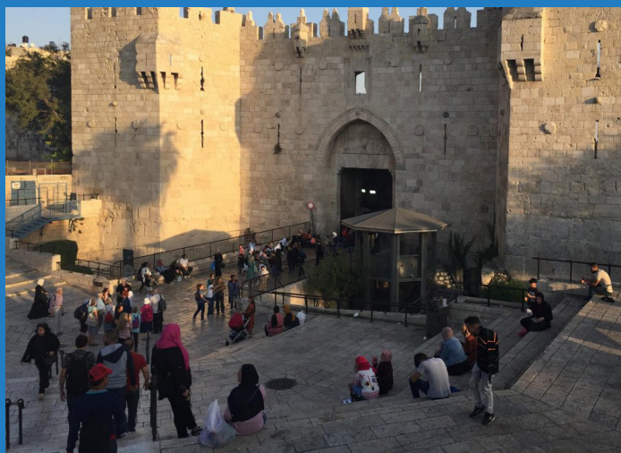
fotky z Konference AUTM Asia 2019 v Jeruzalémě